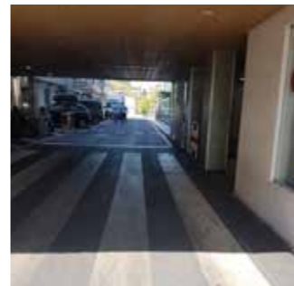
Farmácia: Entrar no edifício pelo lado direito. Raio X: Seguir a rua em frente / Farmácia: Entra na edifício pa lado direito. Raio X: Sigui danti