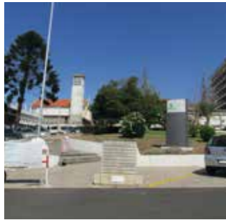
Atravessar a rua e subir as escadas / Salta strada e subi escada