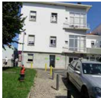
Consulta: Virar à esquerda e atravessar a rua. Análises, Farmácia e Raio X: Virar à direita / Consulta: Vira pa lado esquerdo e salta strada. Análises, Farmácia e Raio X: Vira pa lado diretu