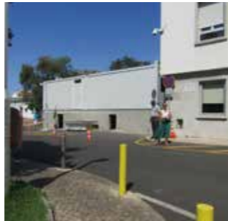
Entrar no edifício das consultas (Local temporário) / Entra na edifício di consultas (Local temporário)