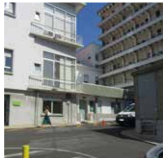
Análises: Atravessar a rua e entrar na sala das análises. Farmácia e Raio X: Virar à direita e seguir em frente / Análises: Salta strada e entra na porta qui teni indicação. Farmácia e Raio X: Vira pa lado diretu e sigui danti