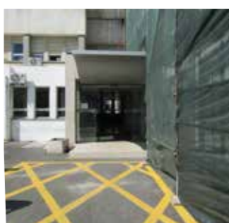
Entrar na porta indicada na imagem. / Entra na porta qui sta indicado na imagem.