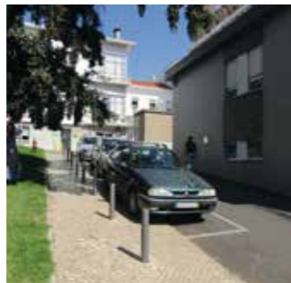
Seguir pela calçada / Sigui caminho qui teni calçada