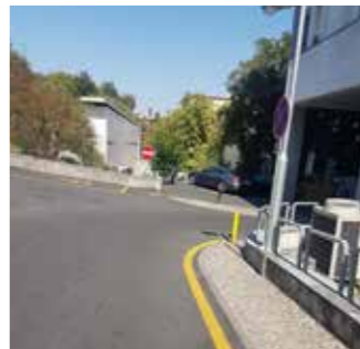
Virar à direita e descer a rua / Vira pa lado diretu e dixi rua