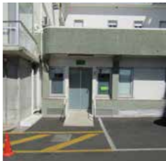
Entrar na sala das análises e tirar uma senha / Entra na sala di análises e tra um senha