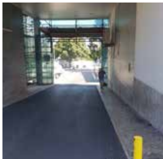
Virar à direita em direção ao Raio X / Vira pa lado direito na direção di Raio X