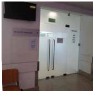
Seguir para o serviço de imagiologia / Siguir para serviço di imagiologia