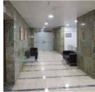
Virar à direita e descer as escadas / Vira pa lado diretu e dixi escada