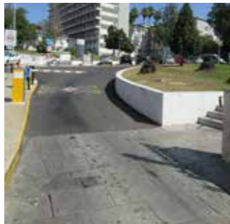
Seguir em frente / Sigui danti