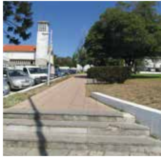
Seguir pela calçada / Sigui caminho qui teni calçada