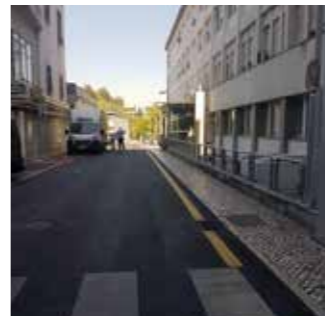
Seguir em frente / Sigui danti