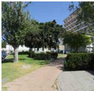
Seguir pela calçada / Sigui caminho qui teni calçada